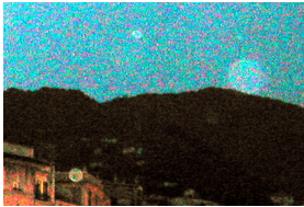
Immagine elaborata per mettere in risalto l'effetto Orbs (Rapallo)