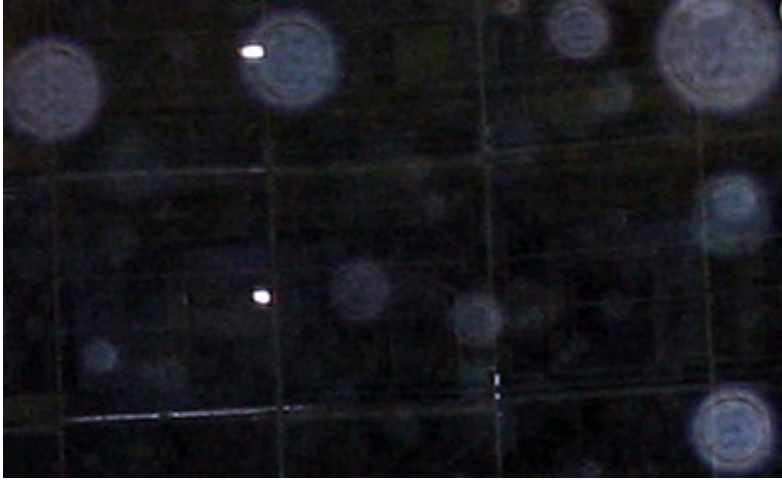
Orbs (Davvero tanti!) in un cantiere a Milano, foto realizzata con una macchina con ottica di medio-basso livello

Ho sempre avuto apparecchi abbastanza buoni che raramente mi hanno dato tale problema. In questa sede allego solo il particolare in questione perché nelle foto vi sono delle persone. Tale distorsione è praticamente assente in tutte le foto che ho fatto con apparecchiatura di qualità (Canon G5).