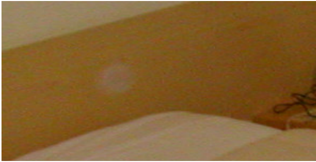
Orbs a S.Caterina