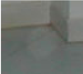
Orbs in hotel a Monastir