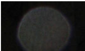
Orbs di Barcellona